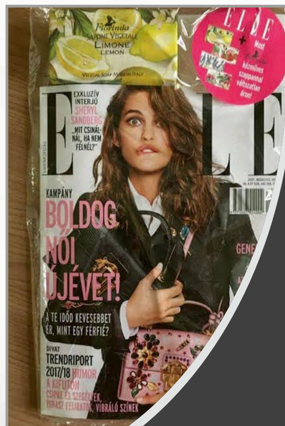
Сотрудничество с журналом ELLE